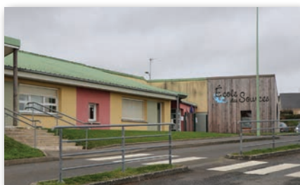
Ecole primaire « Ecole des Sources »