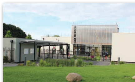
Ecole primaire « Arc-en-Ciel »