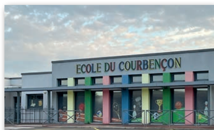
Ecole primaire « Le Courbençon »