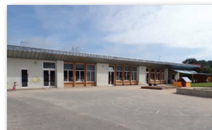
Ecole primaire « La Fontaine au Bey »