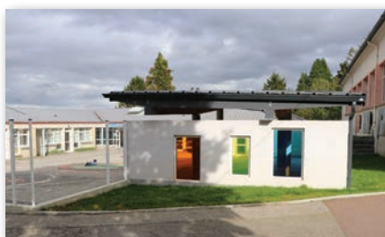
Ecole primaire « Le Petit Prince »