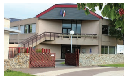
Collège « Le Val de Souleuvre »